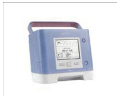
在宅用人工呼吸器