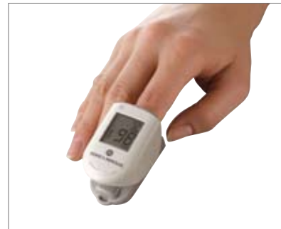
パルスオキシメーター