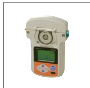
輸液注入ポンプ(栄養・疼痛)