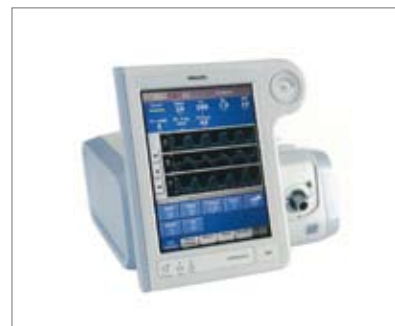
院内用人工呼吸器