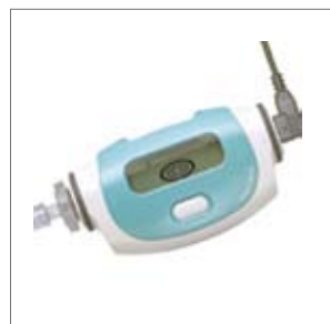
睡眠時無呼吸検査装置