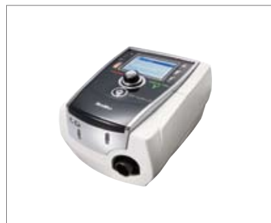
在宅用マスク式人工呼吸器